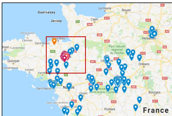
LABORIZON représente désormais 102 sites.

Notre ambition reste intacte, notre objectif à moyen terme consolider notre position de leader du Grand Ouest. Nous allons poursuivre la construction, la structuration d'une entreprise efficiente, organisée autour d'un plateau technique de dernière génération au service de nos patients. »